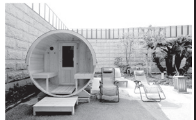
▲「あがんっせ」の貸切バレルサウナ